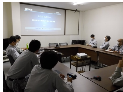
6月15日 滋賀(東滋賀事業場内)